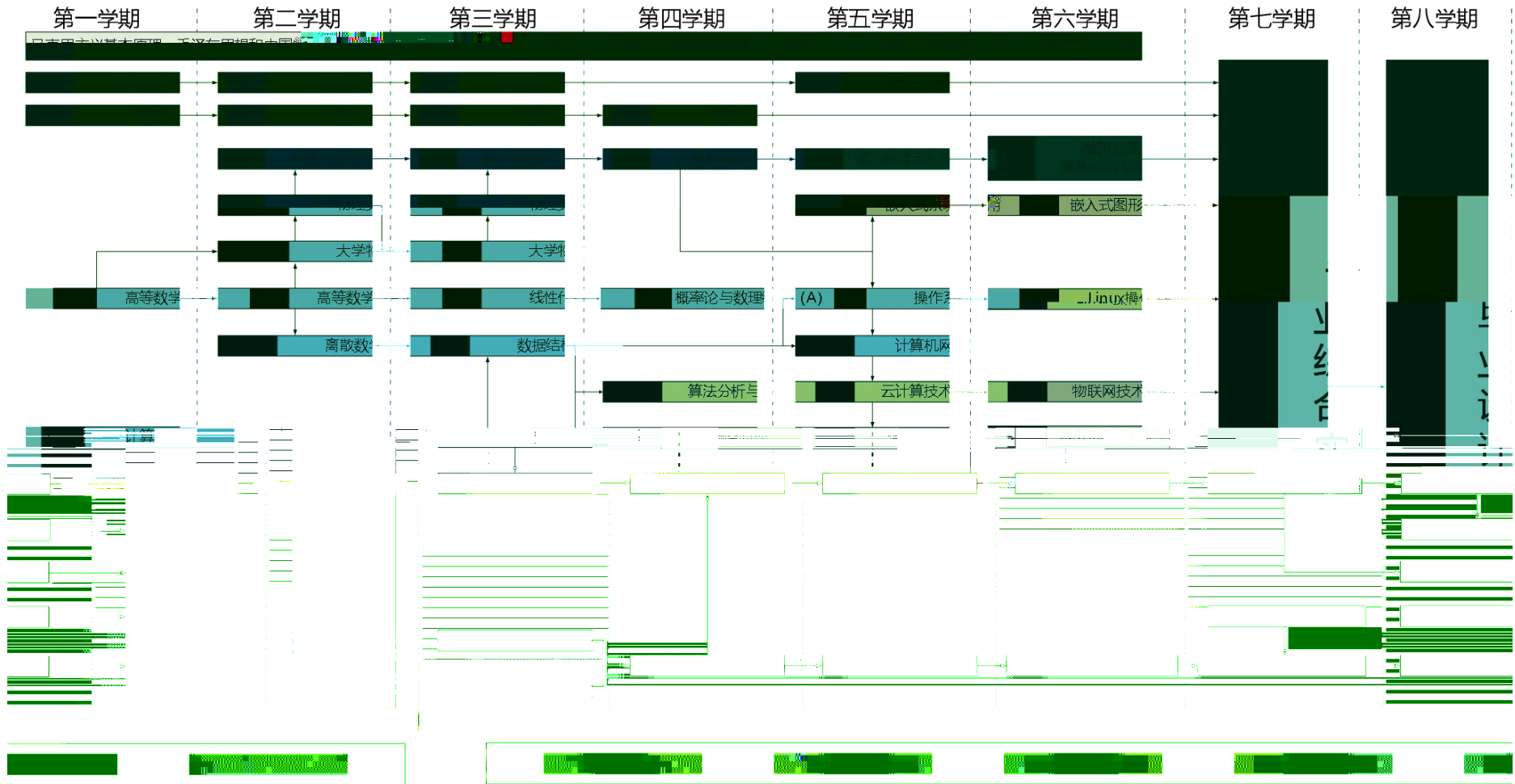
计算机科学与技术2019级人才培养方案课程关系图